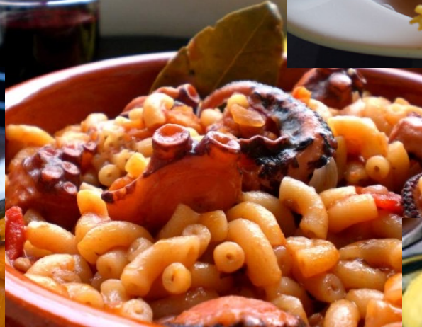
Pieuvre et pâtes