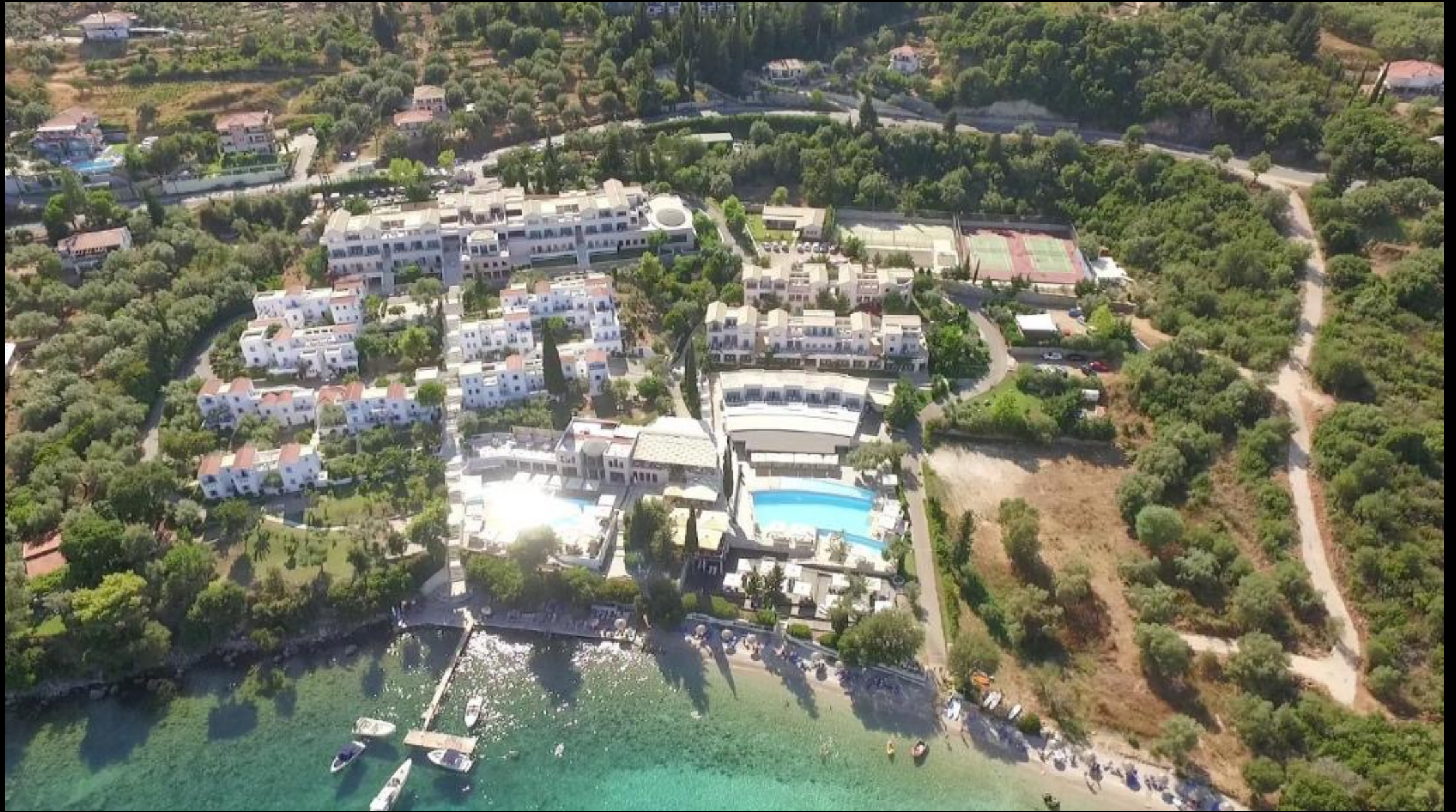
Porto Galini Resort – Lefkas