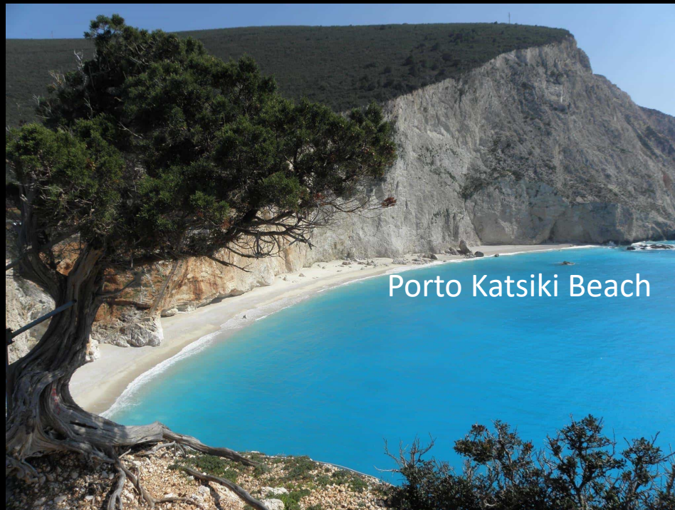
Porto Katsiki Beach