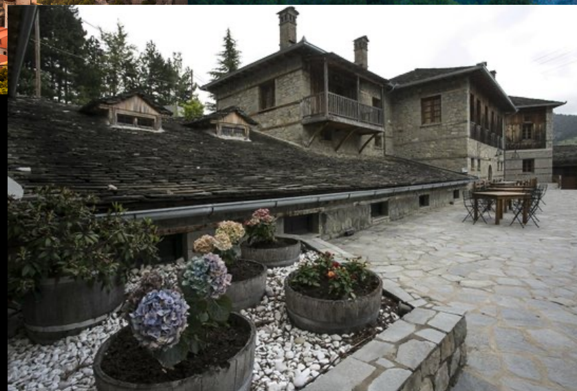
Famous Katogi Averoff winery