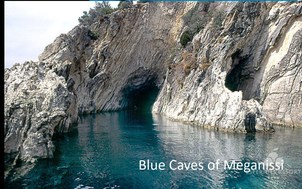
Blue Caves of Meganissi