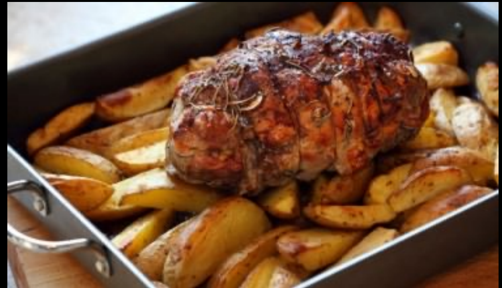
roast leg of lamb