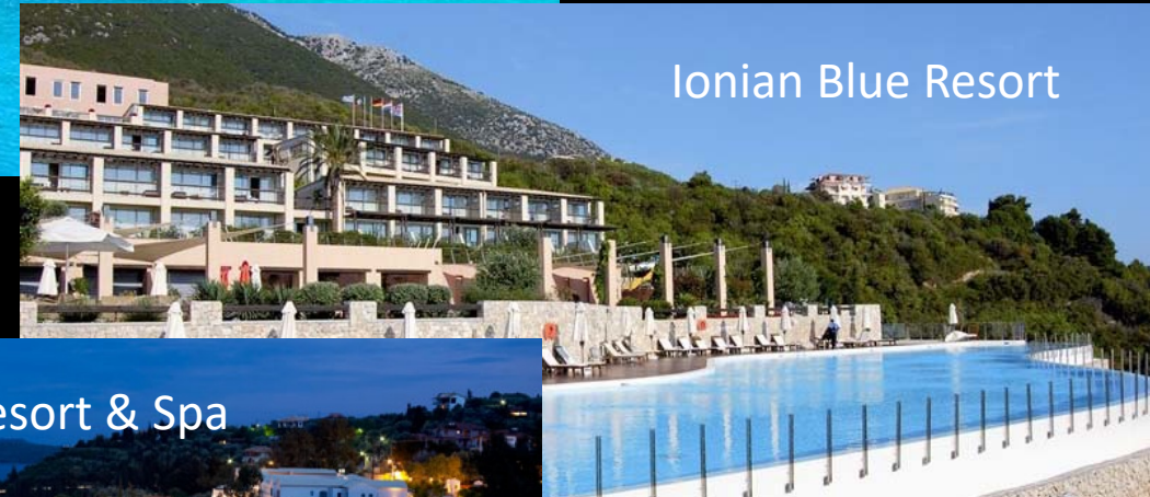
Ionian Blue Resort