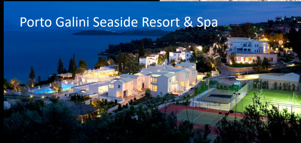
Porto Galini Seaside Resort & Spa