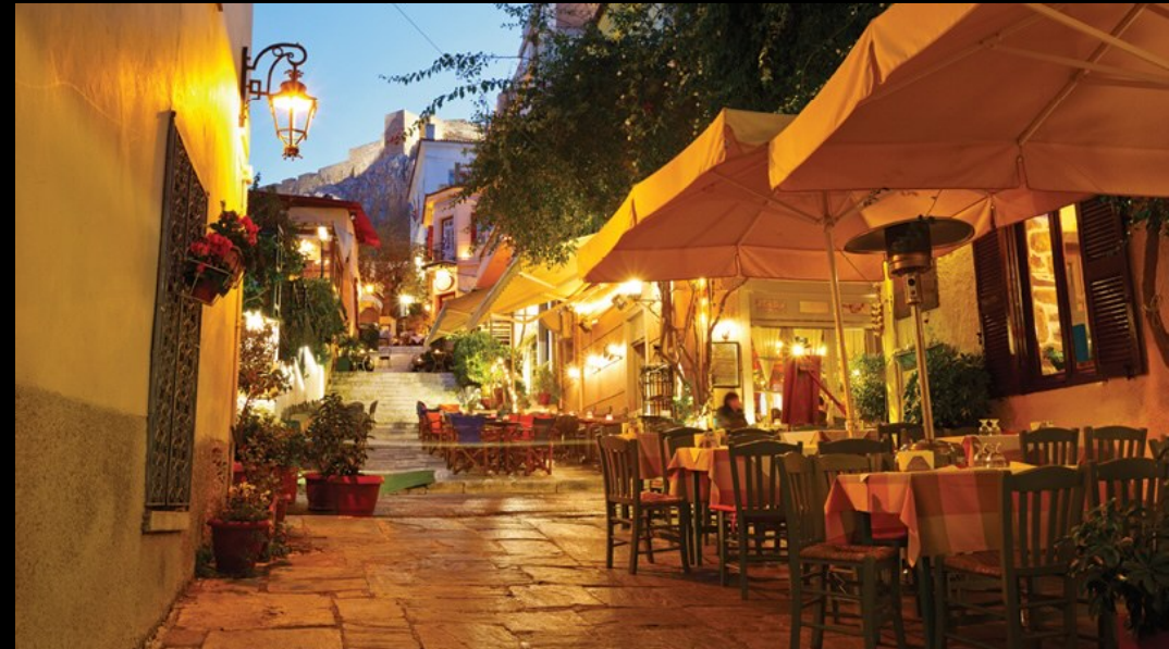
Plaka district – 6 minute walk from hotel