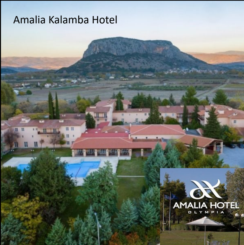
Amalia Kalamba Hotel