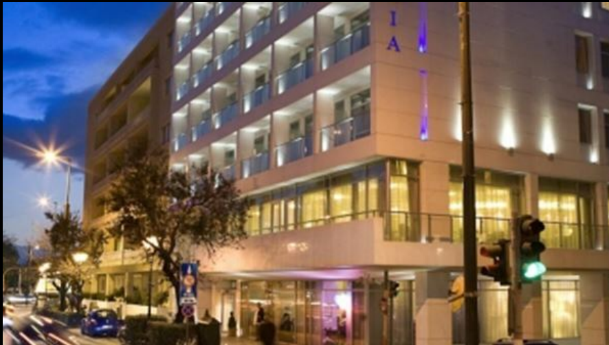
Amalia Athens Hotel